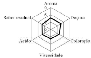
Figura 3 – Gráfico radial representando as médias dos atributos para as amostras de bebida láctea sabor pêssego.

Os valores de viscosidade e acidez considerados médios podem ser devido à formulação utilizada.