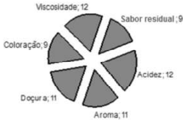
Figura 1 – Resultados obtidos na aplicação do questionário para o levantamento dos termos descritivos.

de julgadores que classificaram um determinado atributo com ‘crítico’.