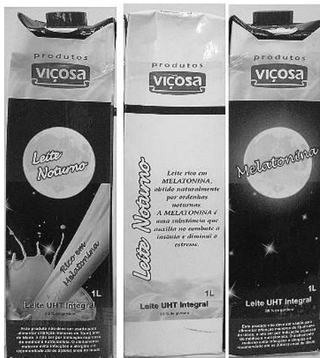
Figura 2 – Exemplos de embalagens avaliadas

expressão "definitivamente não compraria" e na direita, "definitivamente compraria".