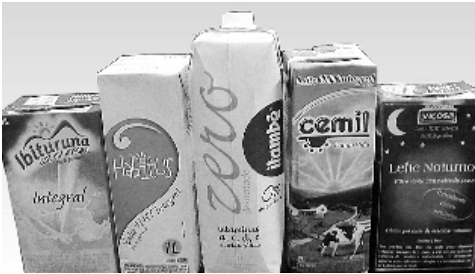
Figura 1 – Embalagens apresentadas nas sessões de grupo de focos.

que foi encarregado de gravar, filmar e anotar as informações de cada sessão. O moderador explicou o propósito da sessão e esclareceu a importância da opinião de cada participante no estudo. Foi utilizado um roteiro (Tabela 1) de perguntas sobre os hábitos dos consumidores durante as suas compras e a apresentação de quatro embalagens de leite de marcas comerciais e uma de produto desenvolvido (protótipo) (Figura 1). Essas embalagens foram apresentadas separadamente e em ordem aleatória. As sessões tiveram duração média de 90 minutos. Também foi ressaltado que não existe resposta certa para as questões abordadas, sendo importante a opinião de cada um.