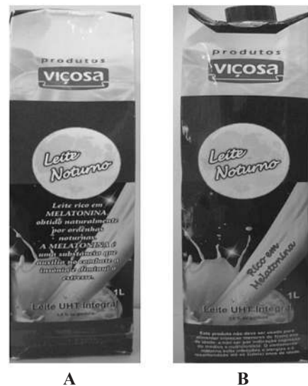
Figura 5 – Embalagem com maior intenção de compra: a- verso e b- frente.

A embalagem com maior intenção de compra para o produto desenvolvido foi a de cor azul, com estrelas e leite derramando, com o nome leite noturno e presença de texto informativo.