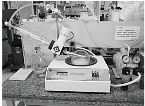
Figura 2 – Evaporador rotativo utilizado no experimento

O processo de evaporação a vácuo ocorreu à temperatura de 60 °C \pm 2 °C em evaporador rotativo microprocessado de bancada da marca Quimis modelo Q344M. A evaporação foi conduzida objetivando encontrar um fator de concentração igual a 4. O evaporado produzido foi conduzido a um condensador de contato indireto no qual a temperatura da água de resfriamento foi controlada em 15 °C \pm 2 °C. Após o cálculo da quantidade de água que deveria ser evaporada em cada repetição, visando alcançar o fator de concentração desejado, realizou-se a evaporação até o volume exato calculado de evaporado, que foi medido em proveta. Na Figura 2 é apresentado o evaporador rotativo durante a concentração das amostras.