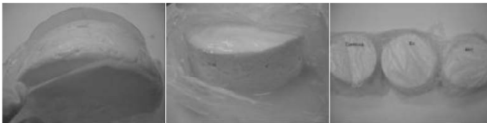
Figura 2 – Atividade dos filmes controle (a), filme 1 (b) e filme 2 (c) sobre o crescimento de Listeria innocua .