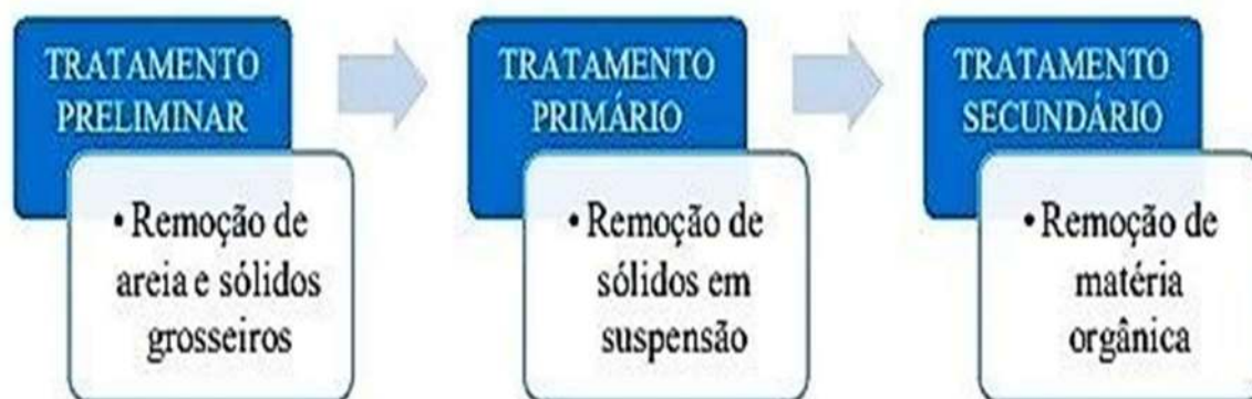
Figura 1. Sequência de tratamento de efluentes lácteos

retirada de sólidos grosseiros; primário, etapa de remoção de sólidos sedimentáveis; e o secundário, que tem como objetivo a degradação da matéria orgânica poluidora (HENARES, 2015). O esquema dessa sequência de tratamento é descrito na Figura 1.